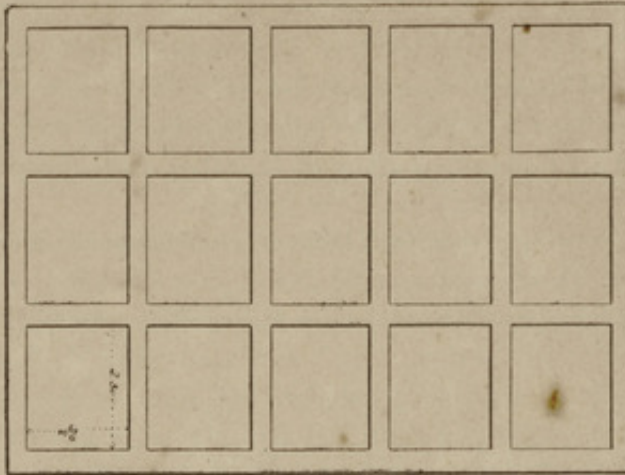
Fig. 1. — Plan.