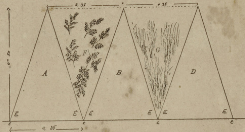
Croquis schématique de la disposition des claies cocoonnières sur les claies d'éducation.

A B D Claies cocoonnières. c c Claies d'éducation. F G Feuillage ou lézarde garnissant l'intervalle des claies cocoonnières.